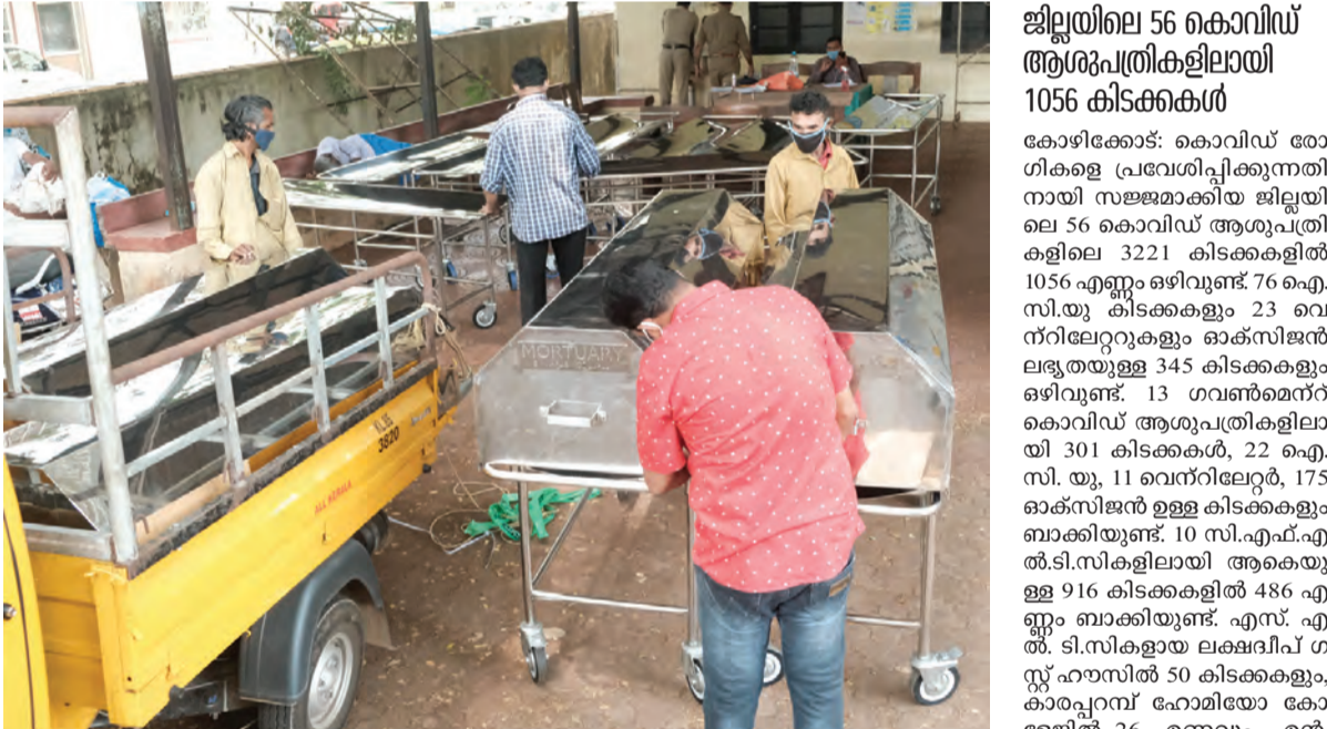
കോഴിക്കോട് മെഡിക്കൽ കോളേജിൽ പുതുതായി എത്തിച്ച രോഗികൾക്കായുള്ള സ്ട്രെച്ചർ ബെഡുകൾ ഇറക്കുന്നു

കോഴിക്കോട്: ജില്ലയിൽ കൊവിഡ് ബാധിതരുടെ എണ്ണത്തിനെക്കാര്യം ഏറെയളവുകൾ നെഗറ്റീവായി മാറുന്നതും ഏറെ അശ്വാസമാകുന്നു. ഇന്നലെ 3927 കൊവിഡ് പോസിറ്റീവ് കേസുകൾ കൂടി റിപ്പോർട്ട് ചെയ്തതായി ജില്ലാ മെഡിക്കൽ ഓഫീസർ അറിയിച്ചു.